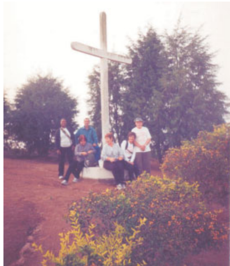
Andarilhos na última caminhada na Serra da Mantiqueira, seguindo pelo calvário

Já neste domingo, dia 28 de junho, a partir das 8 horas encontro no Parque da Moçota para caminhadas curtas, ideal para novatos. Mais informações com Santarnecchi pelo tel: 3652-6658.